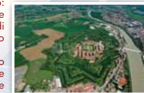
Alessandria, la Cittadella.

Arrivo previsto alla Stazione Ferrovie Stato di Novara : ore 20.30 circa.