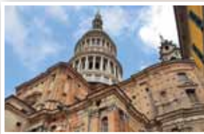
Novara, centro storico.