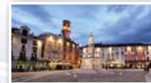
Vercelli, centro storico.

* N. B. I convegnisti che soggiornano a Novara raggiungono Vercelli in treno in 14 minuti, la sede dei lavori è a lato della stazione ferroviaria; la segreteria del Convegno fornirà ogni chiarimento in merito.