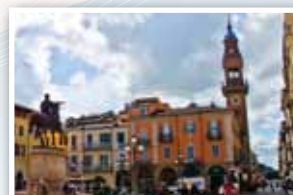
Casale Monferrato, centro storico.

* Partecipazione obbligatoria per gli iscritti al 21° Corso nazionale di Aggiornamento e Sperimentazione didattica, durata 20 ore (v. sito <www.aiig.it>)