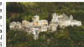
Varallo, Sacro Monte.

Nella mattinata si attraverseranno le "terre del riso" del Novarese e del Vercellese (sosta in un'azienda agricola) per giungere alla fortezza di Verrua, nei pressi del Po, in posizione dominante la pianura padana piemontese. Seguiranno il buffet (al Complesso Universitario San Giuseppe di Vercelli) e, nel pomeriggio, dopo la visita